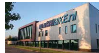
Matrabike Experience Center Waalwijk (NL)

Antwerpsestraat 83, 2840 Reet (gemeente Rumst), België. Tel. 03 888 09 90