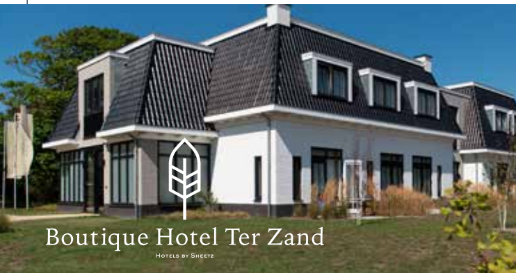
Boutique Hotel Ter Zand

Op een unieke locatie in Zeeland, dicht bij natuurgebied de Zeepedduinen en het strand van Westerschouwen, vind je sinds circa anderhalf jaar het luxe Boutique Hotel Ter Zand . Perfect om heerlijk te genieten van alles wat de veelzijdige Zeeuwse kust te bieden heeft.